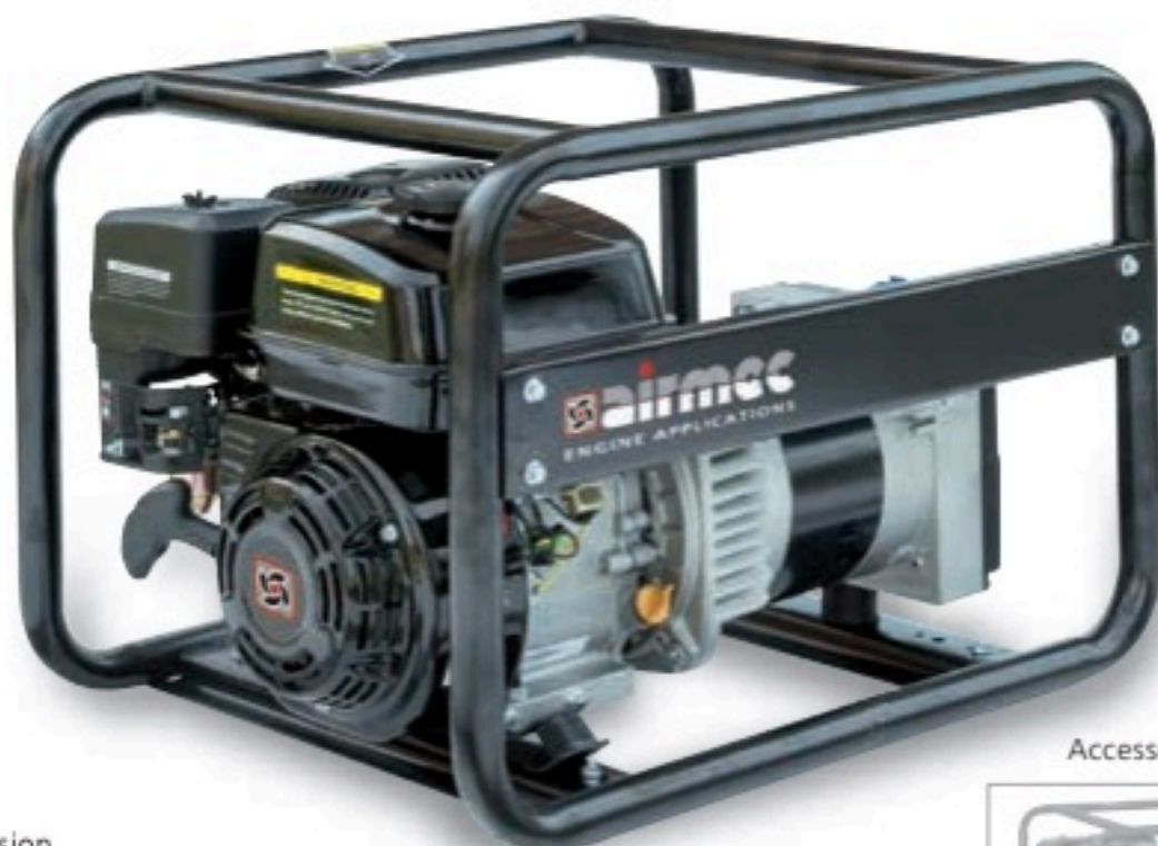
Accessorio - Accessory