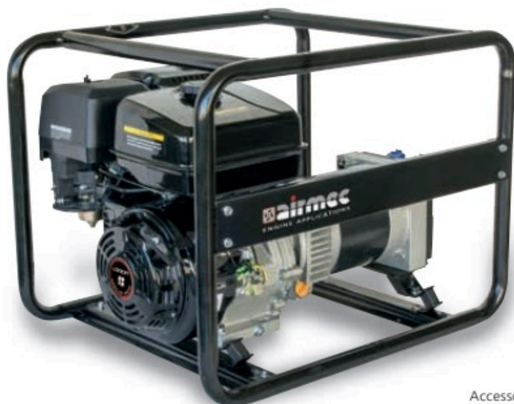
Accessorio - Accessory